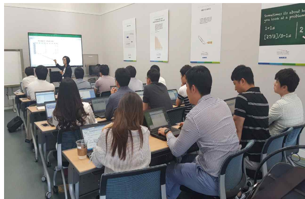
외국인투자기업 온라인채용관 워크숍 운영 (www.foreigncompanyjob.com)