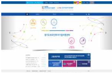
<국문 홈페이지 변경 전>