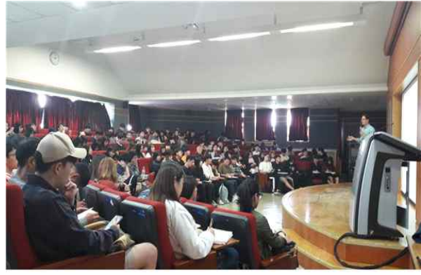
외국계기업 취업전략설명회 지원(20회 1,165명)