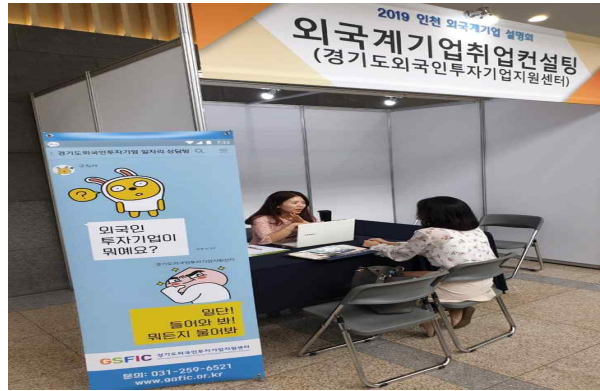
채용박람회 홍보부스 운영(5회 / 수원시, 한국외국어대학교 등)